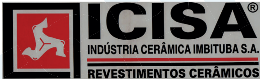
Adesivo tamanho 29 x 10 cm usado nos últimos anos da ICISA