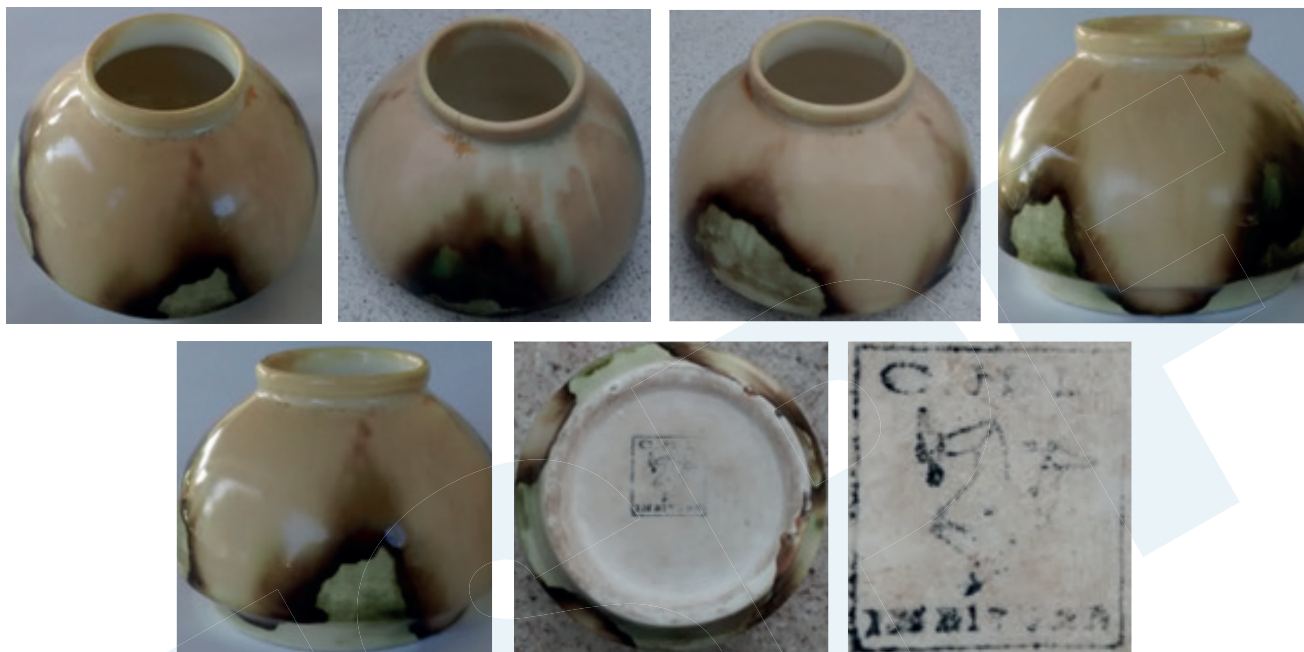
Vasinho decorativo tendo na base carimbo C.H.L.[figura] Imbituba