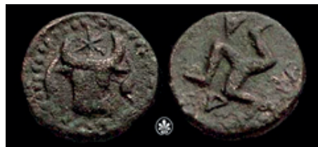
Adada, Pisídia, por volta do século 1º a.C.