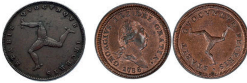
Moedas antigas de Man