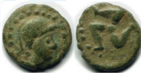
Prostanna, Pisidia, antes de 100 a.C.

Abaixo, imagem de moedas encontradas em cidades da antiga Pisídia, apresentando trísceles de pernas desnudas numa das faces: