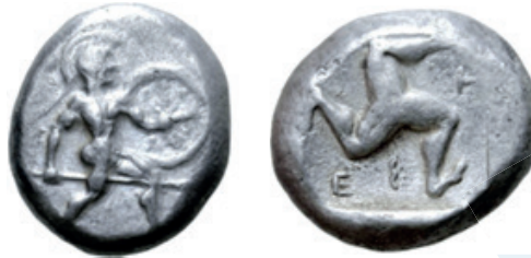
Stater – por volta de 465–430 a.C.

Pisídia – Era uma região interior do sul da Ásia Menor, anexada ao Império Romano e tornada província. É região montanhosa, englobando a parte ocidental da Cordilheira dos Montes Tauros, situada ao norte da Panfília e ao sul da Frígia Gálata, tendo a Cária e a Lícia a oeste, e a Licaônia a leste. Em 74 d.C., a parte sul da Pisídia junto com a Panfília e a Lícia passaram a formar uma província romana. Abaixo: moeda da Pisídia (século II a I a.C.)