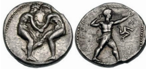
Stater – por volta de 400–370 BC.