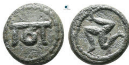
Selge, Pisidia, século II a século I a.C.