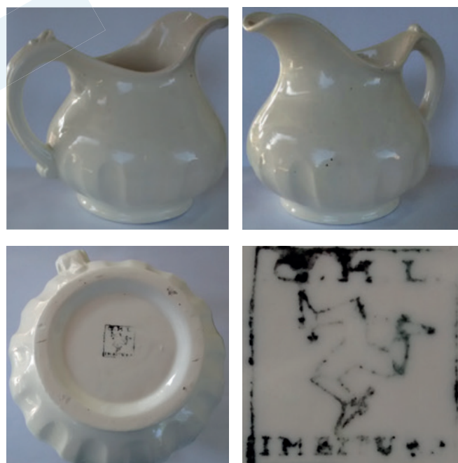
Jarra para água, sucos, etc., tendo na base carimbo C.H.L. [figura] Imbituba