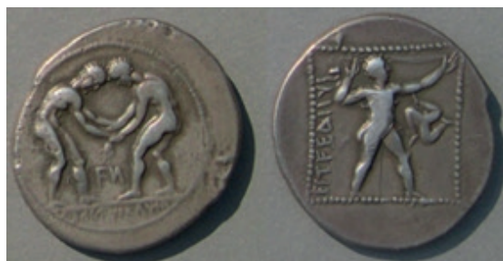
Stater – por volta de 370-330 a.C.

Abaixo, imagem de moedas encontradas na cidade de Aspendo, na antiga Panfília, con-tendo trísceles de pernas desnudas: