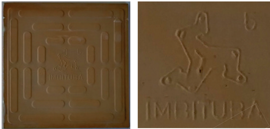
Lado inferior do azulejo 15 x 15 cm e detalhe aumentado